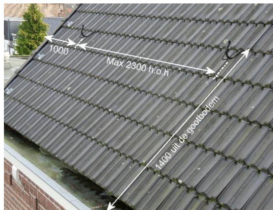
Figuur 4 Patroon dakhaken (in mm)