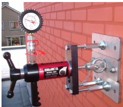
Figuur 5 Methode om (muur)anker te kunnen testen