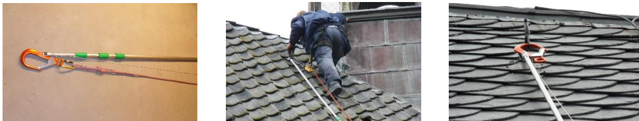
Figuur 2 Telescoopstok met ankerhaak

kan hij het dakvlak of de goot betreden en kan hij zich van ankerpunt naar ankerpunt verplaatsen, waarbij hij voortdurend gezekerd is. Dit betekent dat er ten minste twee vanglijnen aanwezig zijn. Op het moment dat een dubbele zekering niet direct mogelijk is, zijn er telescoopstokken beschikbaar met verbindingsmiddel. Dit zijn hengels waarmee een vanglijn aan een ankerpunt op afstand kan worden bevestigd. Bij zijdelingse toepassing hiervan moet rekening gehouden worden met het pendule-effect.