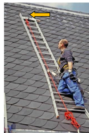
Figuur 3 Ladder opgehangen aan een ladderhaak

Bij ladderhaken is het van belang dat de gebruiker speciaal hiervoor geschikte ladders inzet. Deze ladders zijn onder andere voorzien van een verstevigingsplaat met een V-vormige onderzijde, die de ladder positioneert op de haak en niet de sporten vervormd. Daarnaast zijn (rol)steigers een goed alternatief, met name voor (groter) onderhoud.