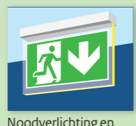
Noodverlichting en bewegwijzering